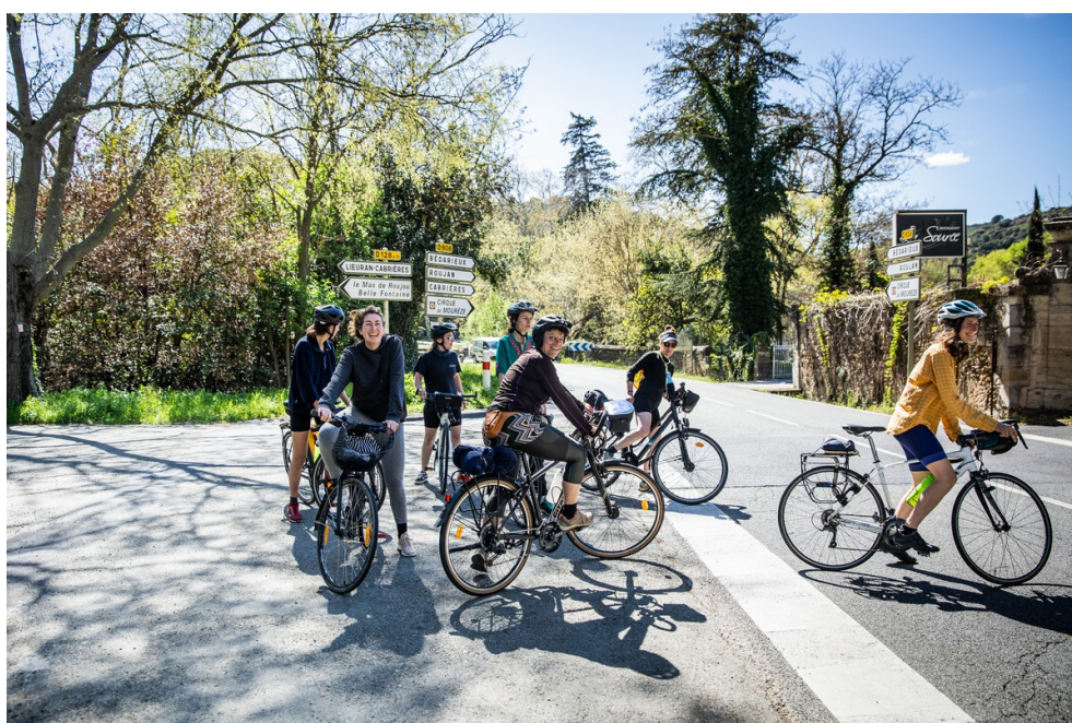
La spécificité des Oiseaux et des Oiselles : les déplacements en mobilités douces.

Et pour ce qui est de l'itinérance, tout se passe « en mode oiseaux ». Des matelas installés dans des salles ou des bivouacs dans les jardins, une douche quand l'occasion se présente et des repas préparés au réchaud par une cuisinière différente chaque jour. « On sait déjà où on va dormir, on nous propose un repas chaque soir sur nos lieux de concerts... Par rapport à d'autres tournées, c'est plutôt confortable », assure Anaïs. L'objectif étant simplement de ne pas perdre d'argent.