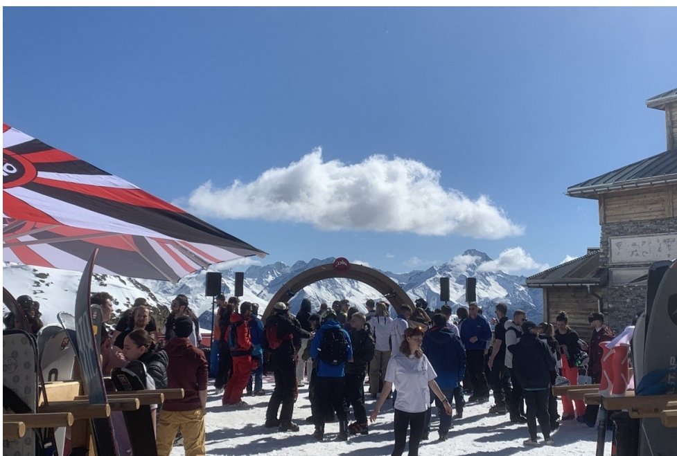
De nombreux festivaliers sont en tee-shirt sous le soleil printanier.

horaire. Il faut dire qu'elle a fait le voyage depuis Sydney, en Australie, juste pour passer la semaine ici, puis quelques jours à Nice. Elle ne s'est pas arrêtée à Paris, elle y est déjà allée deux fois.