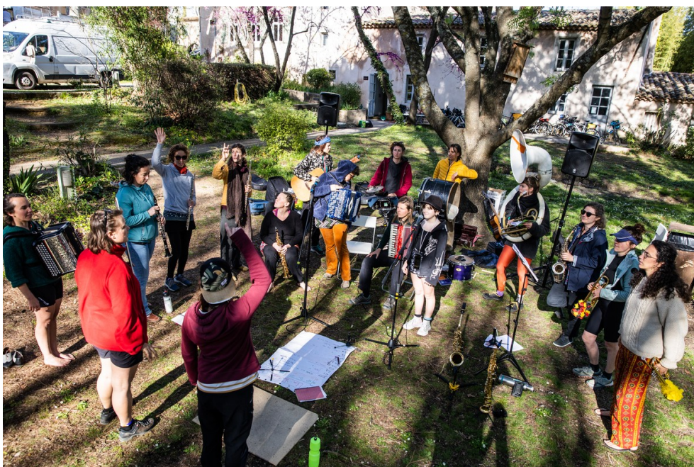
L'orchestre répète sous les arbres.

concocté une tournée de douze jours et quelque 250 kilomètres. Avec chaque soir un concert dans une nouvelle commune.