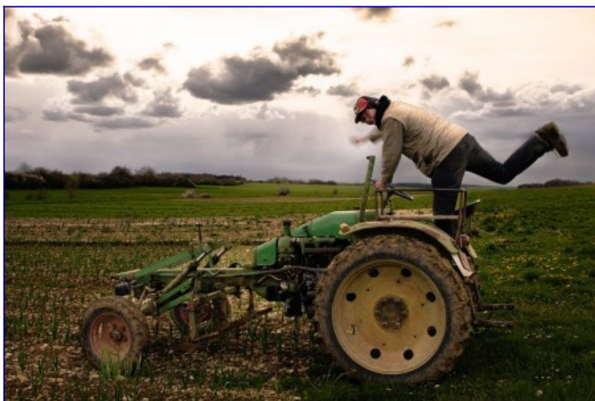
Près de Bure, des maraîchères cultivent les terres confisquées par le nucléaire

Le fait que nous parlions de nos vies permet à chacun et chacune de s'interroger sur la sienne. Ce que je défends aussi dans la pratique théâtrale, c'est de chercher de nouveaux imaginaires, de retrouver une sensibilité à ce qui nous entoure. Beaucoup de gens qui ont vu notre spectacle à des étapes de travail y ont reconnu leur propre vécu, leurs émotions face à la catastrophe écologique. J'espère aussi que le spectacle fera du bien aux amis qui luttent. Je suis très contente que le théâtre soit cet endroit d'interrogation et de partage.