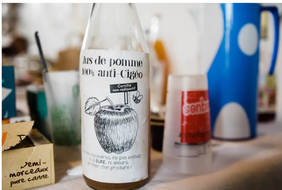
À Bure, dans la Meuse, auprès des militants opposés à Cigéo.

Malgré tout, la lutte contre Cigéo est âpre, marquée par une forte répression. Le projet vient de franchir une nouvelle étape, avec le début de l'expropriation des derniers propriétaires situés sur l'emprise du projet. Comment tenir ?